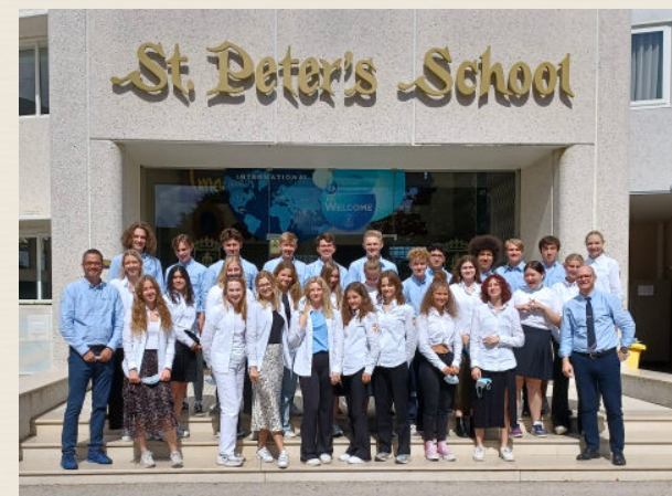
Cambridge IV i Portugal 2021