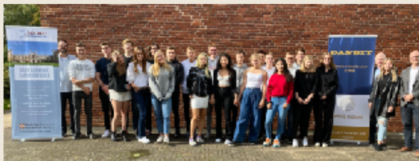
AS/A & A Level Cambridge III, 2020

NYT! til 1. årgangselever: Du får mulighed for, at følge undervisning gratis i en længere periode, så du får en fornemmelse for niveauet. Så kan du senere på året vurdere, om du vil meldes på kurset officielt eller vente. Det skyldes, at tempoet er højt og der er ikke meget overlap fra den danske matematik det første år.